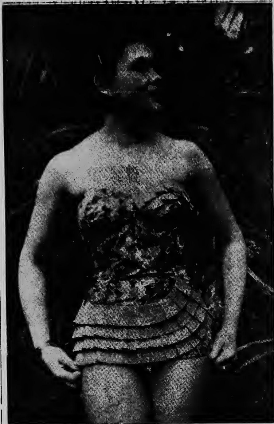
Den hardin di palmas di un parque na Boedapest e modelo di traha di banjo pa verano 1962 a ser transporta. Riba e foto aqui un dje modelonan for dje coleccion.

Despues di un lucha di mei ora e comunista nan tabatin un perdida di cien hombre, asina un comunicado oficial publica pa Saigon ta bisa. Di e trupanan di gobierno a muri cinco militar y ocho a keda herida.